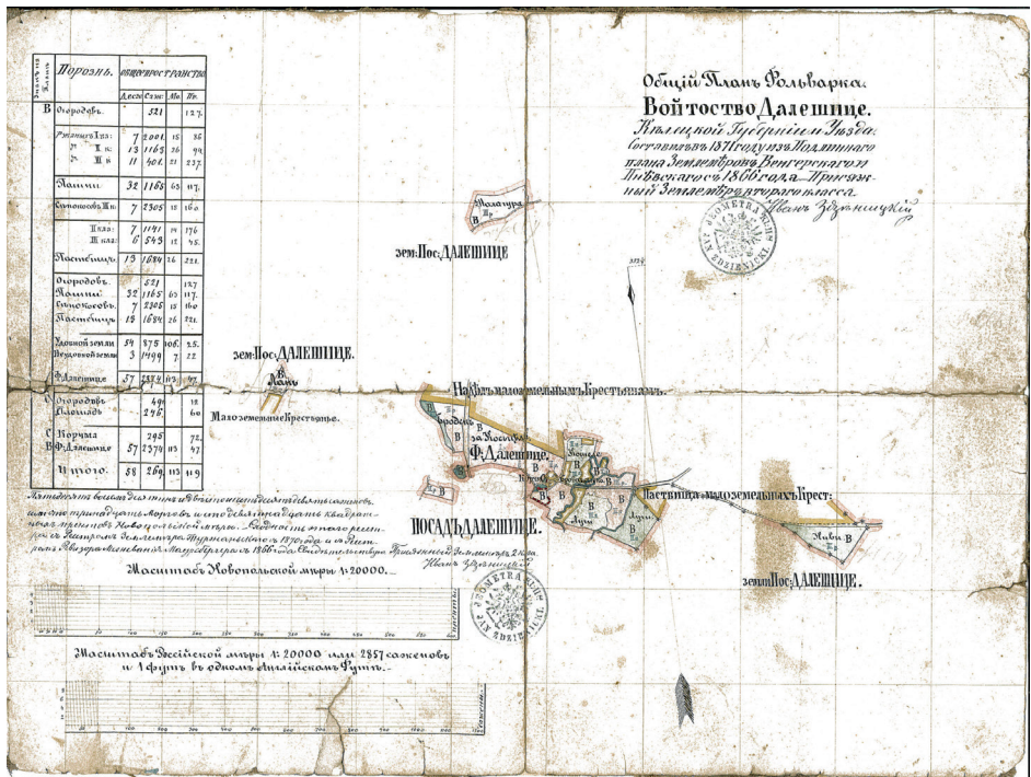
Plan Wójtostwa Daleszyce. AP w Kielcach.

W czasach Królestwa Polskiego oddzielono grunty orne dawnego wójtostwa daleszyckiego od Dankowa, przekształcając je w folwark pańszczyźniany 7 . Wkrótce potem dokonano szczegółowego opisu zabudowań należących do tego majątku wraz rysunkami poszczególnych budowli. Zespół składał się z dworu z zabudowaniami gospodarskimi wójta, dworu folwarcznego ze stajniami, z piwnicą i ze studnią 8 .