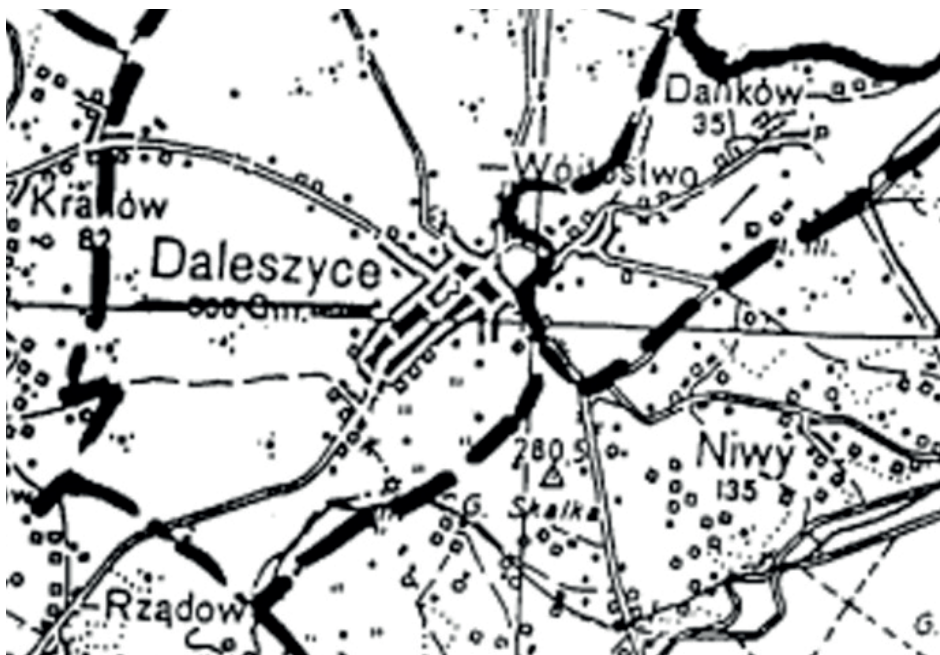
Położenie Dankowa-Wójtostwa na podkładzie współczesnym. Widoczne upośledzenie miasta Daleszycy w gruntach, przysądzonych miastu podczas procesu lokacyjnego w 1570 r.

Sołectwo Danków-Wójtostwo położone jest na prawym brzegu rzeki Belnianki, na wschód od Daleszyc. W rzeczywistości mamy tu do czynienia z dwiema osadami – wójtostwem miasta Daleszycy położonym bliżej miasta oraz dawną osadą młynarską Danków, położoną nieco na północ.