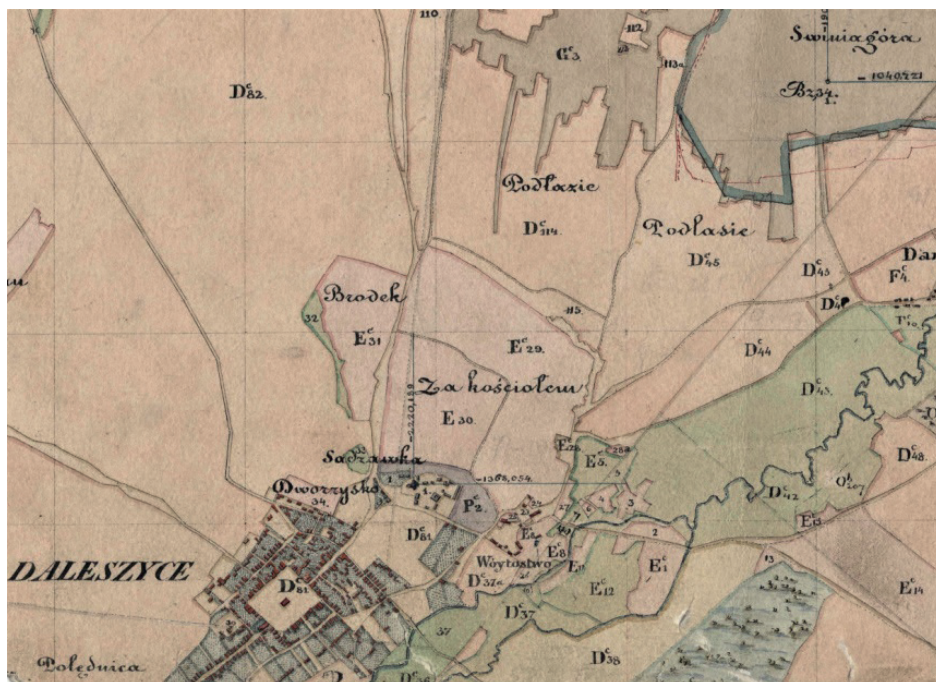
Wójtostwo daleszyckie i wieś (wójtostwo Danków), na mapie z lat 30. XIX w. AP Radom Zbiór Kartograficzny ZDP Gub Kiel., sygn. 315.

Z gruntów tych dziesięcinę snopową i konopną oddawano biskupom krakowskim, ale wymieniono jedno pole, z którego dziesięcinę odbierała plebanowi daleszyckiemu, co może wskazywać, że należała wcześniej do karczmy lub młyna 2 .